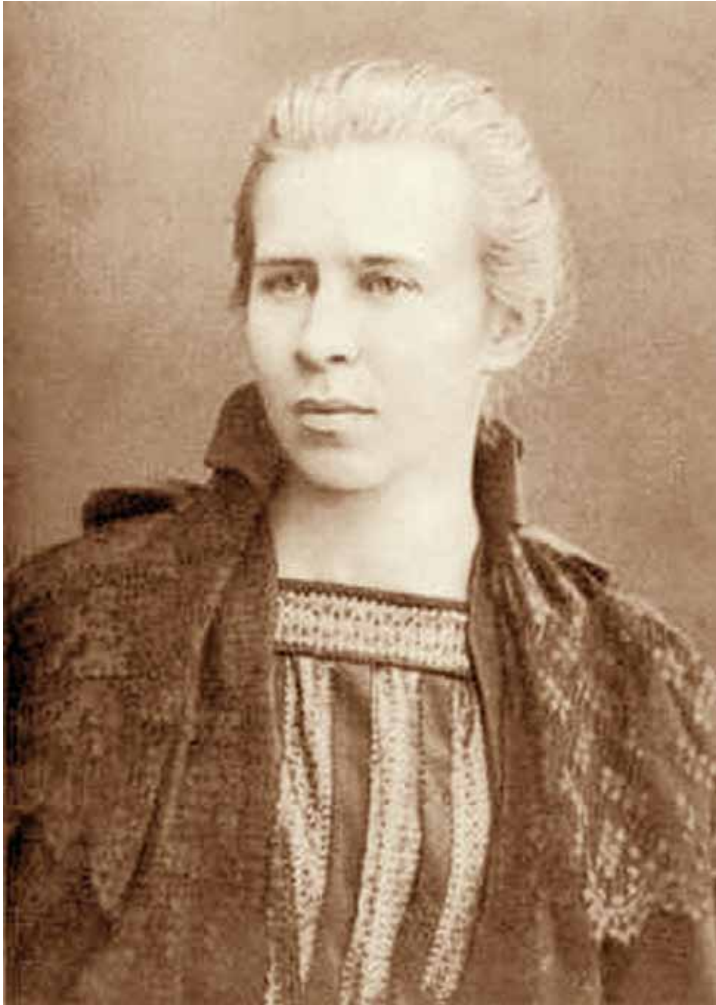
ЛЕСЯ УКРАЇНКА (до 145-річчя від дня народження) LESIA UKRAINKA (to her 145th birthday) LESIA UKRAINKA (zu ihrem 145. Geburtstag)