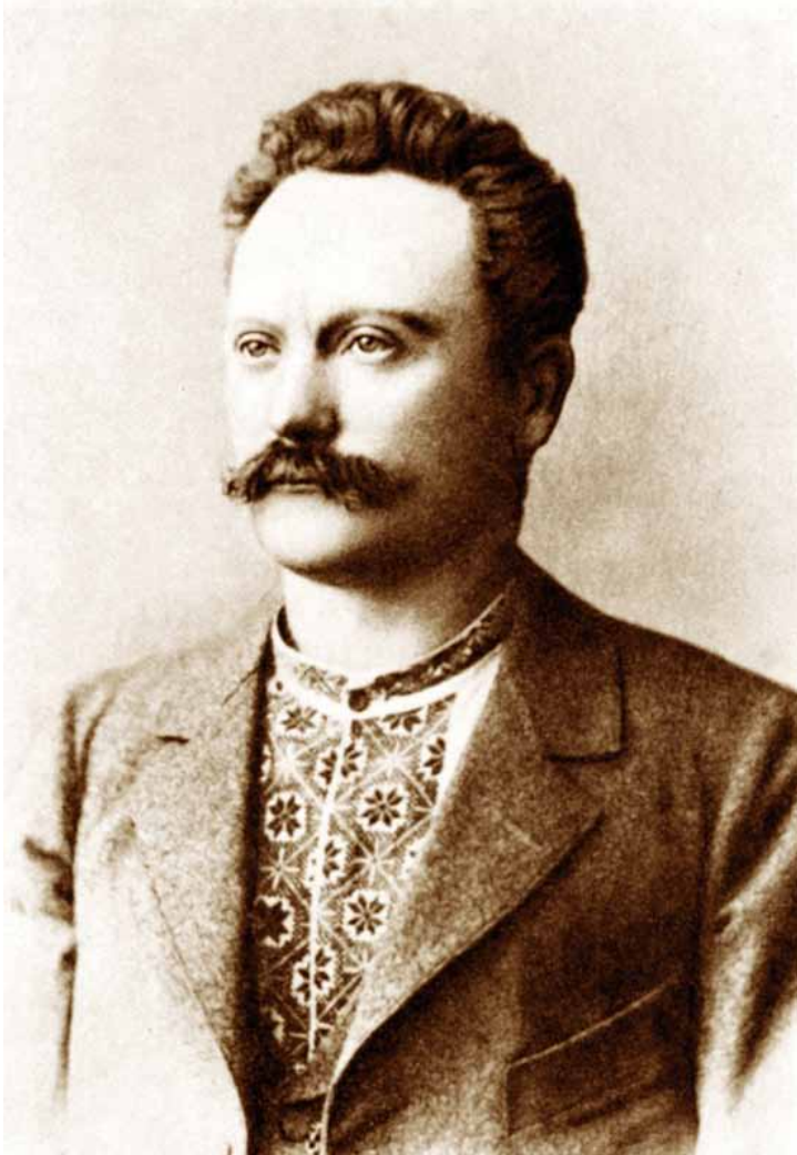
ІВАН ФРАНКО (до 160-річчя від дня народження) IVAN FRANKO (to his 160th birthday) IVAN FRANKO (zu seinem 160. Geburtstag)