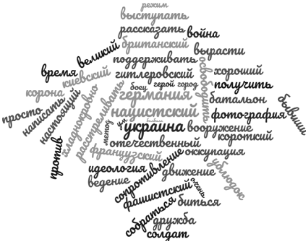
Рисунок 4 – Хмара слів (колокацій) телеграм-каналу сімоньян