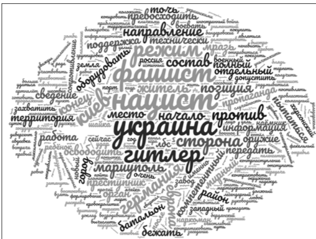
Рисунок 5 – Хмара слів (колокацій) телеграм-каналу Воєнкор Котенок Z

ми словами. Але й у неї найчастіше, окрім України, згадується Німеччина (у тому ж контексті, що й у солдовійова), а також Британія. У декількох дописах пропагандистка розповідає про те, що «британська корона» нібито співпрацювала з фашистською Німеччиною. Для неї також популярними є вислів «київський режим», дієслова «звільняти» (тобто «Україну від нацизму»), «розстрілювати» (ідеться про вигадані пропагандисткою випадки нібито «розстрілу» нацистами мирних громадян України).