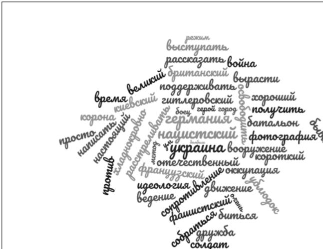
Рисунок 3 – Хмара слів (колокацій) телеграм-каналу солдовійова